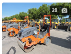
HAMM HD10C VV